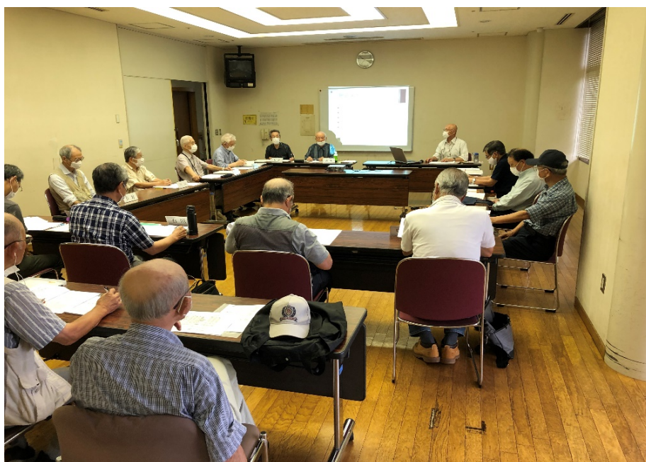
令和2年度 定例総会の様子 今回は全員マスク着用 3密対応です