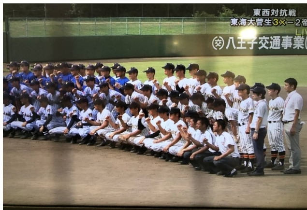
東京都高校野球東西対抗戦 東海大菅生 vs 帝京 閉会式後の記念撮影 2020.8.10 於 ダイワハウススタジアム八王子 八碁連HP https://hachigoren.com