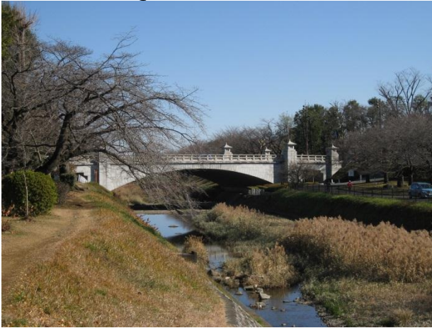
陵南公園から見た東浅川橋(長房町、東浅川町)

http://www.shiminkatudo-hachioji.jp/gorakuren/