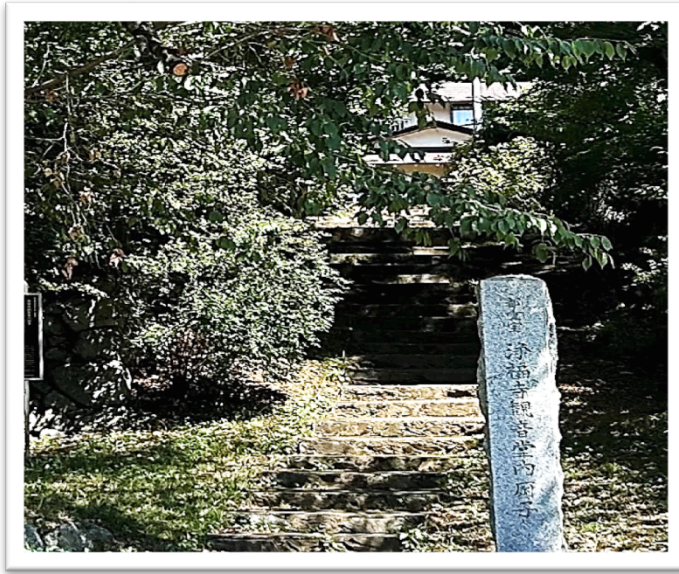
浄福寺（城跡）の山門（下恩方町）