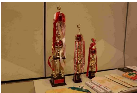
トロフィーと景品