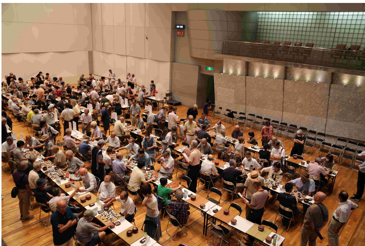
メイン会場となった小ホール