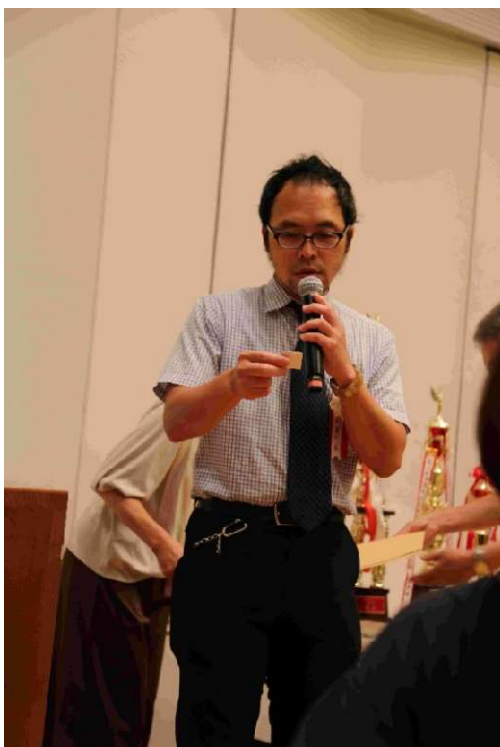
熊 丰七段様による抽選