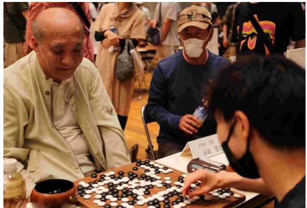
国立市と立川市により決勝戦の主将对局