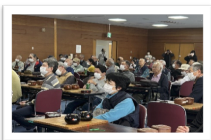
緊張するで開会式で

1回戦から、どのクラスも熱戦が行われ、昼食をはさんで各クラス共4回戦が行われました。大会の結果は以下の通りですが、中には、小学生や中学生の将来有望な選手が上位に入り、人だかりの観戦者を集めていたのが印象的でした。