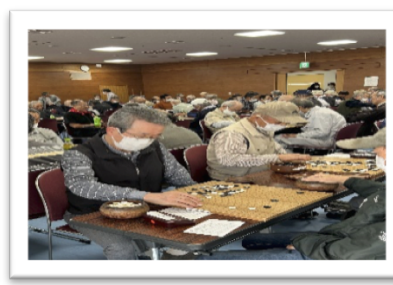
熱戦始まる・・・