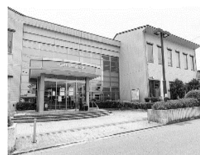
恩方市民センター