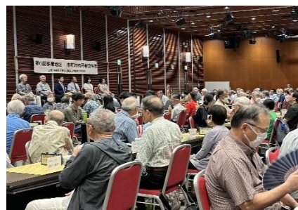
第6回開会式の模様

優勝は国分寺市、準優賞は国立市、三位は西東京市で、八王子市は第19位でした。応援有難うございました。