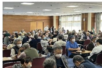
昨年度市民大会参加者