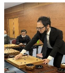
熊丰プロの指導碁

日本棋院 熊丰（ゆうほう）七段による指導碁 日時 令和6年10月6日（日） 10時30分より 場所 東浅川保健福祉センター4階 参加資格 二段以下の八碁連会員 募集人数 12名（先着順で締め切ります。） 参加費 2,000円 内容 第1ラウンド 10時30分～12時00分 第2ラウンド 13時00分～14時30分 第3ラウンド 14時45分～16時15分